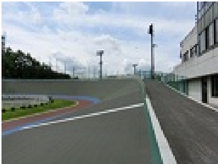
ホームストレッチから第1コーナー