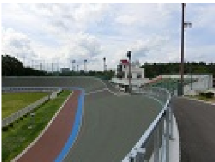
バックストレッチから第3コーナー