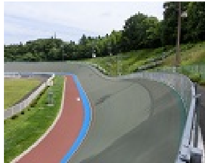
第2コーナーからバックストレッチ