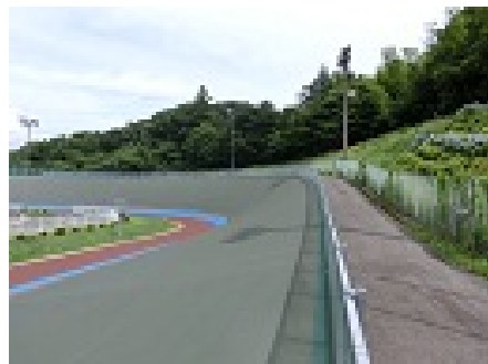
第4コーナーからホームストレッチ